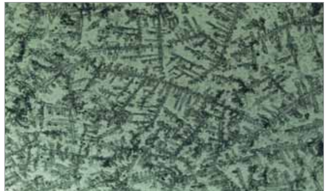
Рис. 2. II тип мікрокристалізації ротової рідини (дані світлової мікроскопії зразків ротової рідини при малому збільшенні (10x10/18))