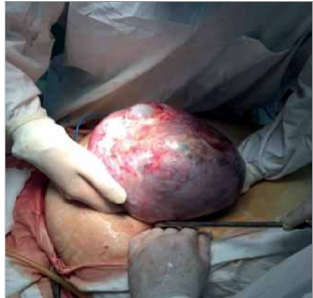
Рис. 3. Кістома яєчника

кози. Операційна рана загоїлась первинним натягом. Жінку виписали додому на 10-ту добу післяопераційного періоду.