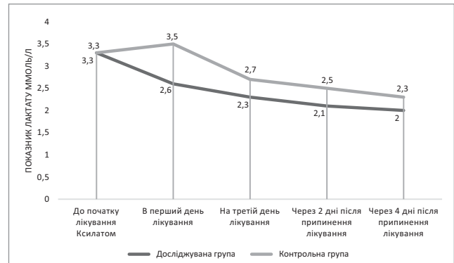
Рис. 2. Рівень лактату до та після лікування препаратом Ксилат (Юрія-Фарм) у досліджуваних групах, p < 0,05

За результатом гістологічного дослідження встановили кістому яєчника. У післяопераційному періоді жінці призначили інфузійну терапію з додаванням препарату Ксилат (Юрія-Фарм), антибіотикотерапію, антикоагулянтну терапію, антимікотичні препарати. У післяопераційному періоді комплексна інфузійна терапія з додаванням препарату Ксилат сприяла нормалізації показників крові, зокрема лактату і глю-