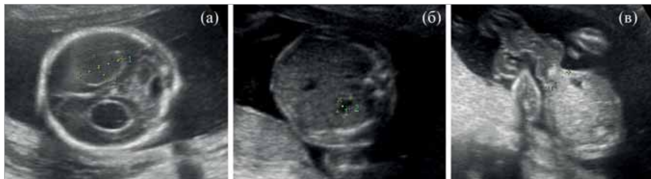
Рис. 1. Вагітність 21–22 тиж. Асоційовані аномалії у плода з омфалоцеле та хромосомною патологією: (а) кисти судинних сплетінь великих розмірів; (б) мікрогастрія, атрезія стравоходу; (в) омфалоцеле, аплазія артерії пуповини та потовщення вартових драглів. Каріотип плода 47, XY+18 (с-м Едвардса)

Серед випадків діагностованої хромосомної патології при ОЦ найчастіше зустрічався синдром Едвардса (53,1%, n=17), на другому місці – синдром Патау (28,1%, n=9); на третьому місці –