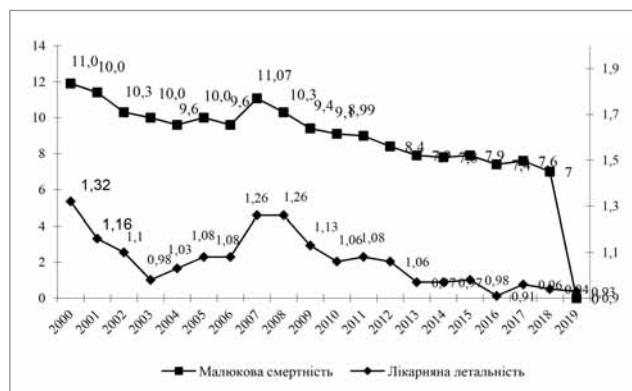
Примітка: дані малюкової смертності за 2019 р., попередні. Рис. 2. Динаміка малюкової смертності (на 1000 народжених живими) і лікарняної летальності дітей першого року життя (%), Україна, 2000–2019 рр.

За даними державної статистики, укомплектованість лікарських посад у 2019 р. коливалася в різних профілях лікарень (92,33% — у дитячих обласних, 87,8% — у дитячих міських, 85,28% — у дитячих інфекційних, 75,4% — у дитячих інфекційних лікарнях, коефіцієнт