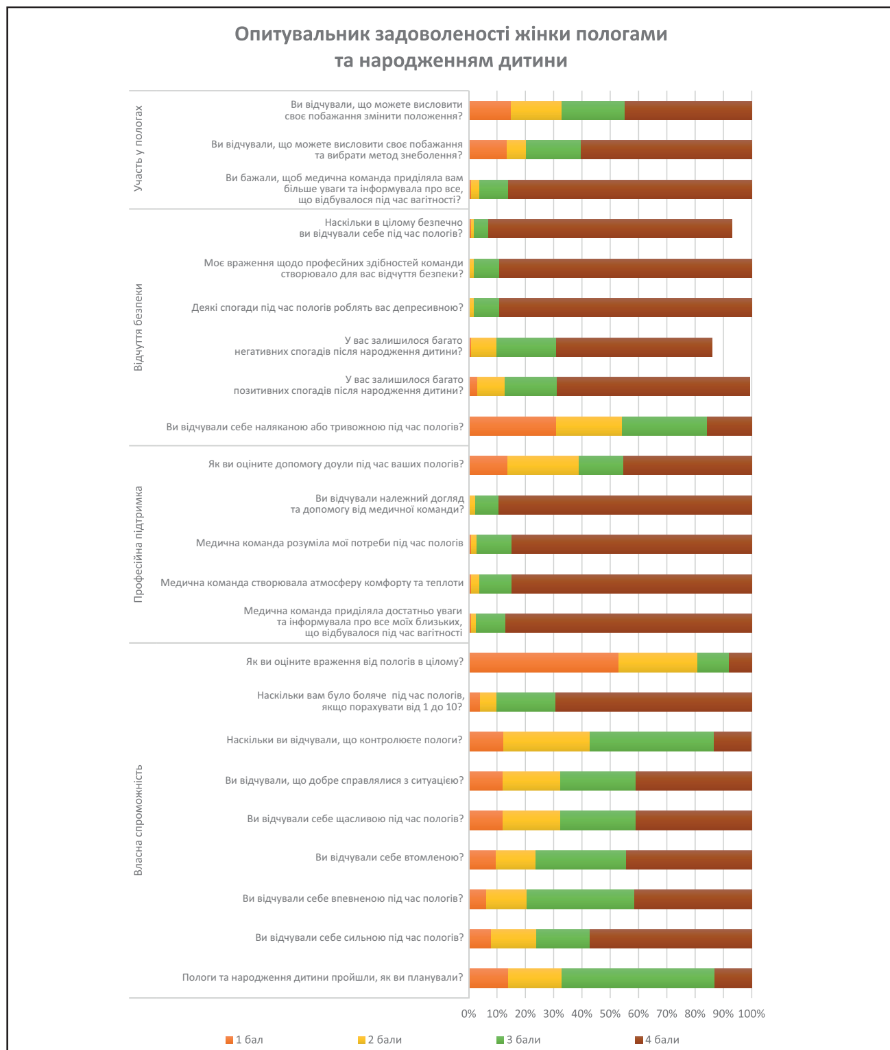
Рис. 1. Результати шкали задоволеності жінки пологами та народженням дитини

ним питанням через їхню непередбачуваність. Відповідно плани пологів можуть приводити до нереалістичних очікувань, розчарувань або незадоволення, але також можуть сприяти спілкуванню між жінками та медичними працівниками [3].