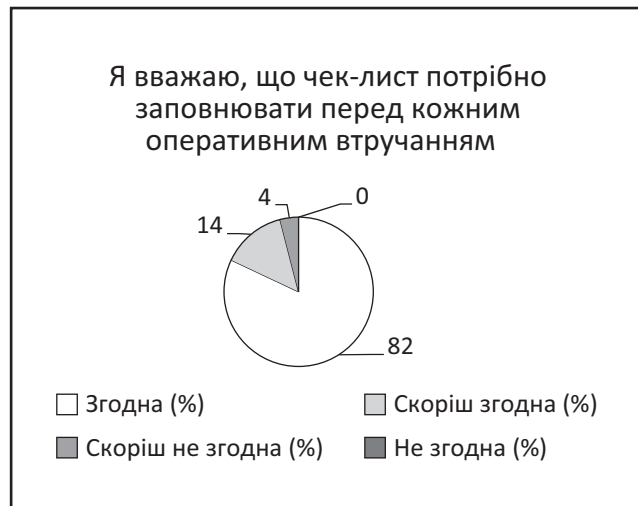
Рис. 2. Оцінка пацієнтками необхідності чек-листа «Безпечна хірургія»

ватися перед кожним оперативним втручанням (рис. 2) і 96% хотіли б, щоб його використовували під час майбутніх хірургічних втручань. Ці результати підкреслюють, що сучасні пацієнти хочуть активніше брати участь у медичних рішеннях, готові активно співпрацювати з медичними командами та цінують власну безпеку під час хірургічних втручань. Так, 42% опитаних вказують, що медичний персонал має враховувати їхню думку щодо застосування певних процедур в операційній.