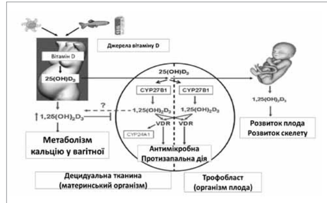
Рис. 2. Обмін вітаміну D під час вагітності

плода, чия ДНК лише вдвічі менша, ніж у матері, а в певних випадках, таких як зачаття з донорською яйцеклітиною, абсолютно чужорідна. Важливо, що дефіцит вітаміну D призводить до розвитку запалення та васкуліту, що виявлено під час обстеження плацент жінок із преєклампсією. Тому для жінок із групи високого ризику розвитку преєклампсії вкрай важливою є профілактика дефіциту вітаміну D на прекоцепційному етапі, яку принаймні слід розпочати в період ранньої гестації, хоча ефективність може бути недостатньою [12,20,23].